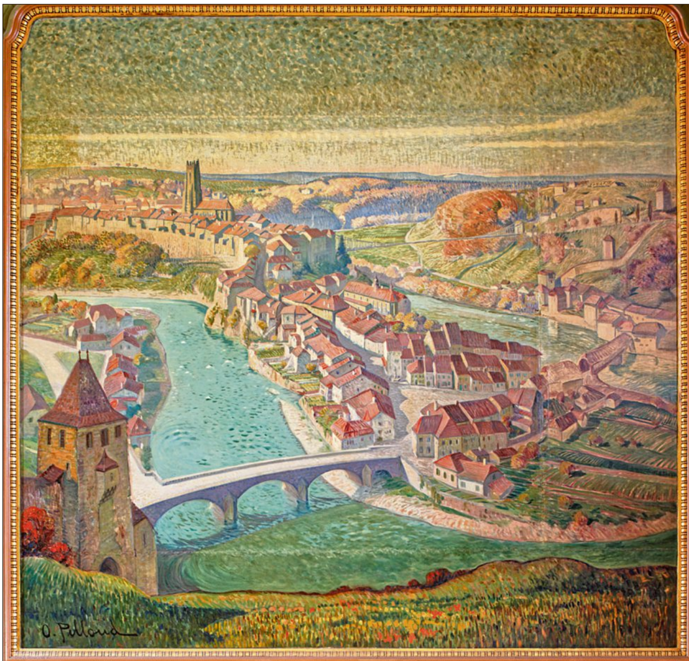
Oswald Pilloud (autoportrait réalisé vers 1900) a peint, pour le buffet de la gare de Lausanne, cette vue de la ville de Fribourg. A droite, son marché.