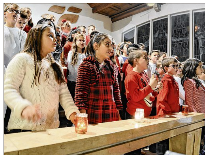
A Courtepin, l'église s'est emplie du chant de plus de 200 enfants.

celles du bâtiment – qu'ils ont décorées – pour y entonner des chants. Avant-goût de Noël aussi à Courtepin mercredi soir, lors du concert organisé à l'église du village par l'établissement scolaire. L'église a été animée par une foule de près de 700 personnes, dont 200 enfants, qui ont chanté pour la bonne cause. Selon les vœux des enseignants, qui organisaient pour la première fois la manifestation, les 1500 francs de dons récoltés iront à la fondation Corelina, que soutient Lauriane Sallin, notre Miss Suisse, présente pour l'occasion. NR