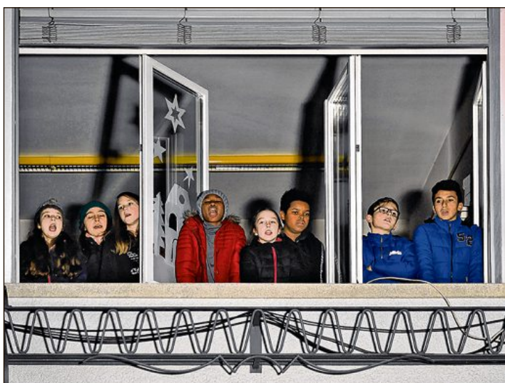
Dans le quartier de la Vignettaz, les écoliers ont chanté aux fenêtres donnant sur la cour de l'école.

> RÉCEPTION POPULAIRE en l'honneur de Benoît Rey, président du Grand Conseil en 2016. Thé et soupe offerts à la population, animation musicale par la Landwehr et la Concordia, discours. Place Georges-Python, dès 17 h 30. A 18 h 45, cortège jusqu'à la salle paroissiale Saint-Pierre (par la rue de l'Hôpital, Miséricorde et la rue des Ecoles) où se poursuivra la soirée officielle. > ALLEMAND Le pratiquer en partageant un moment de convivialité. Espacefemmes, 13 h 45-15 h 45. > EN DEUIL AU CŒUR DES FÊTES Moment de recueillement pour l'absence d'êtres aimés décédés. Centre Sainte-Ursule, rue des Alpes 2, samedi 11h. > CONTES pour les enfants. Librairie Saint-Augustin, rue de Lausanne 88, samedi 10 h 30.